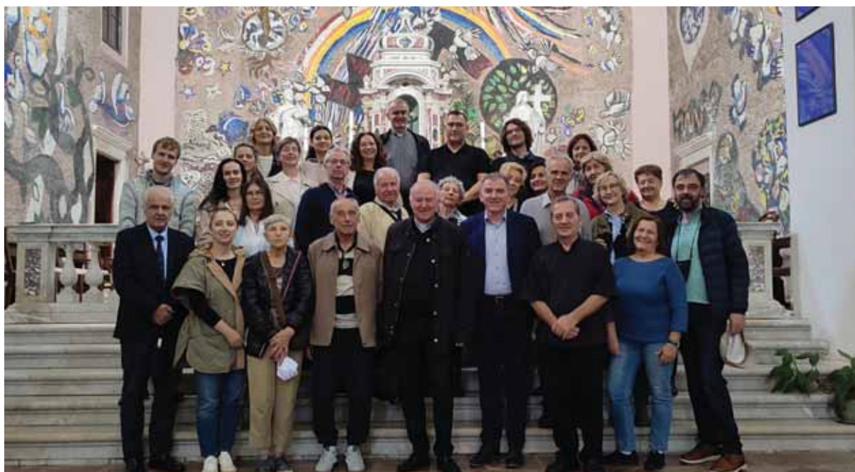
Slika 2. Mons. Renzo Pegoraro s članovima HKLD-a u župnoj crkvi sv. Eustahija u Dobroti, tijekom hodočašća u Boku kotorsku, zaljev hrvatskih blaženika i svetaca