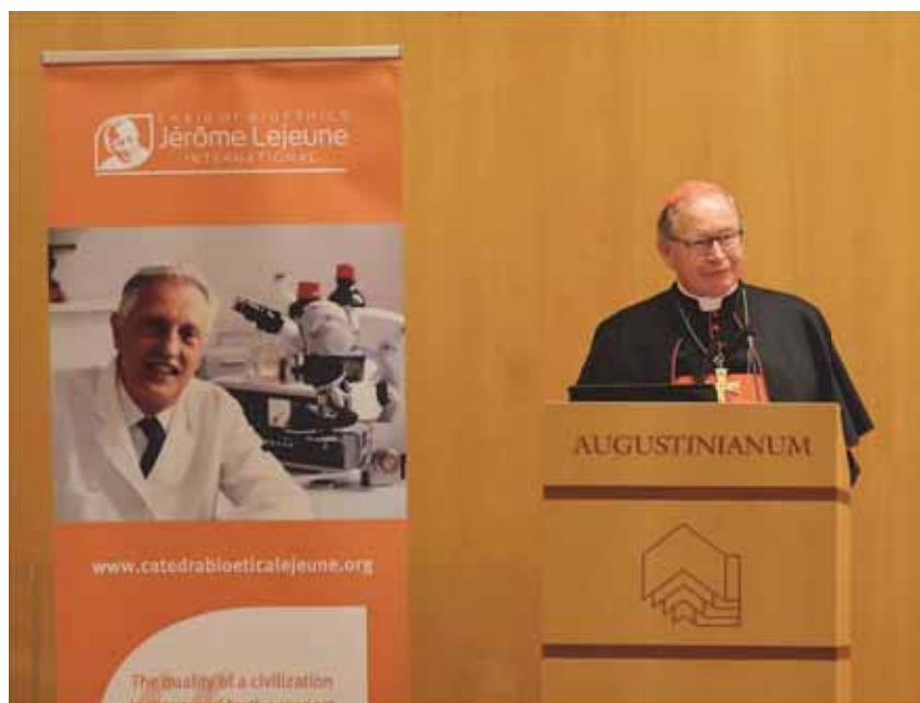
Cardinal Eijk during his talk.

Kardinal Willem Eijk iz Utrechta među kardinalima ima reputaciju kao osoba jasnog i otvorenog stava o pitanjima života i bioetike. Njegovo otvoreno ponašanje, tipično za Nizozemca, priskrbilo mu je i kritike, unutar i izvan Crkve, kako u Nizozemskoj tako i izvan nje. Ali također mu je priskrbilo reputaciju jasnoće u vremenima konfuzije, posebno u zemlji poput Nizozemske, koja je bila pionir u legalizaciji i praksi eutanazije, pobačaja, istospolnih brakova i transrodnog aktivizma.