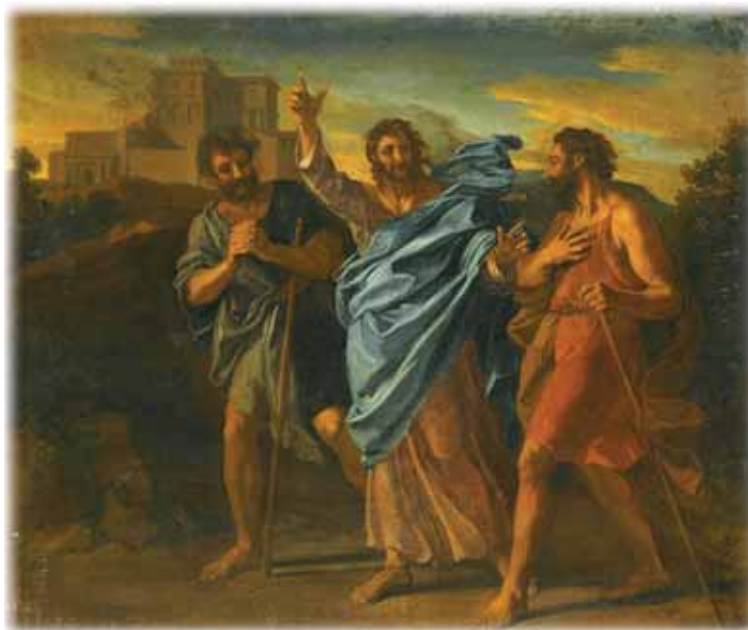
Put u Emaus