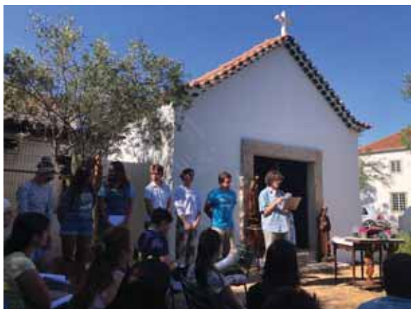
Molitva vjernika ispred kapele na imanju Quinta da Texuga na kojemu je održan ovogodišnji Tirocinium AD MMXXIII