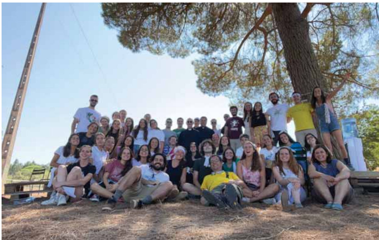
Mladi iz Hrvatske na međunarodnom ljetnom kampu za mlade medicinare Tirocinium AD MMXXIII