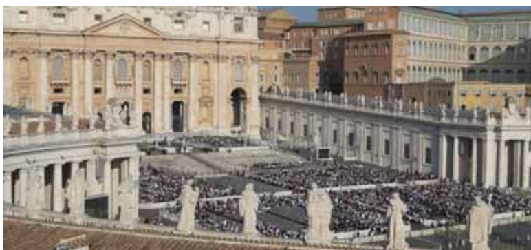
View of St Peter's Basilica & Square from the roof of the Institute of St Mary the Child.