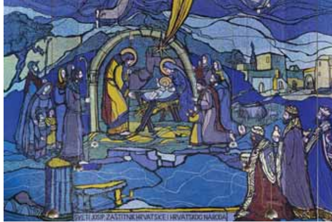
Josip Botteri Dini: Prikaz Isusova rođenja (glavni oltar u Nacionalnom svetištu sv. Josipa u Karlovcu)