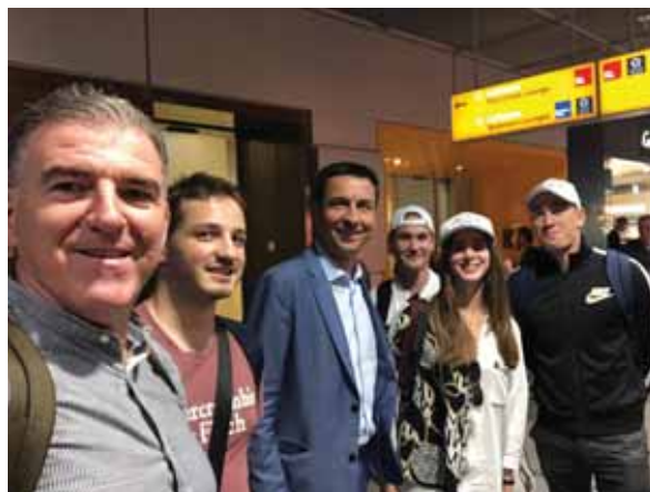
U zračnoj luci sudionici Tirociniuma iz Hrvatske susreli su i hrvatskog zastupnika u Europskom parlamentu gosp. Ladislava Ilčića