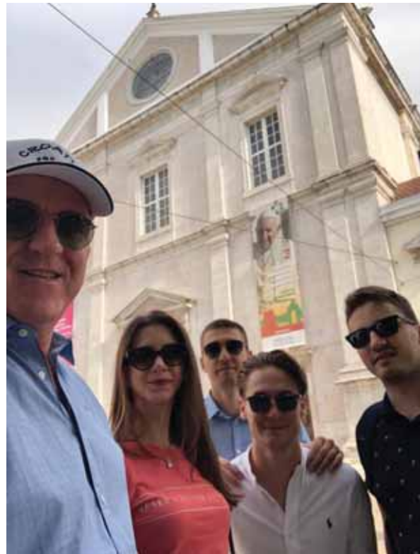
Ispred crkve sv. Roka koju su u Lisabonu podigli isusovci